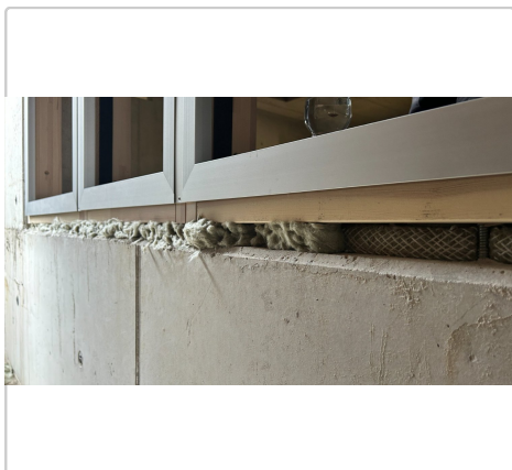
Ausgeführte Arbeit 3: Olepovanie namontovanych fasad na športovej hale pre vrch PR fasad, pohľad juh A22 02.06.2026, 21:52