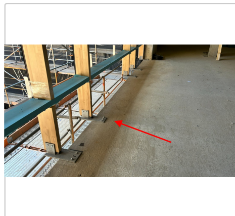
Ausgeführte Arbeit 1: Montage der unteren Konsolen für die PR-Fassade an der Sporthalle, Ansicht Süd, A25–A27 26.06.2026, 08:35